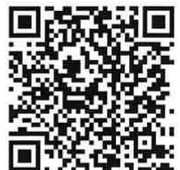
埼玉県 HP 勤労者向け融資制度のご案内